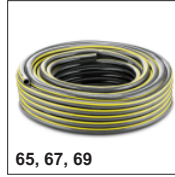
65, 67, 69