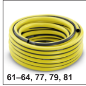
61-64, 77, 79, 81