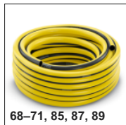
68–71, 85, 87, 89