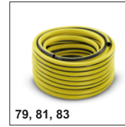
79, 81, 83