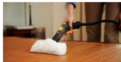
ハンドブラシにカバーを装着したイメージ