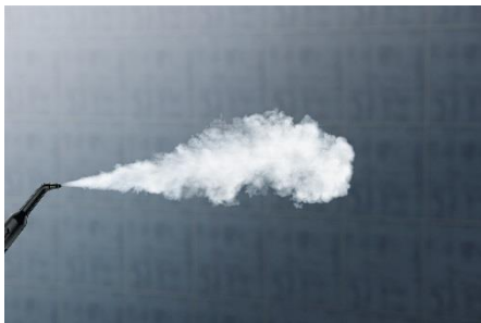
ケルヒースチーム イメージ

高い除菌力を持つケルヒースチームクリーナーは、ご家庭のみならず、免疫力の低い子供や高齢者が集まる保育園や養護施設など、衛生管理が求められる施設でも広くご利用いただいております。お客様の生活環境の向上に貢献しています。