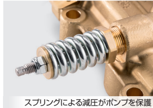
スプリングによる減圧がポンプを保護