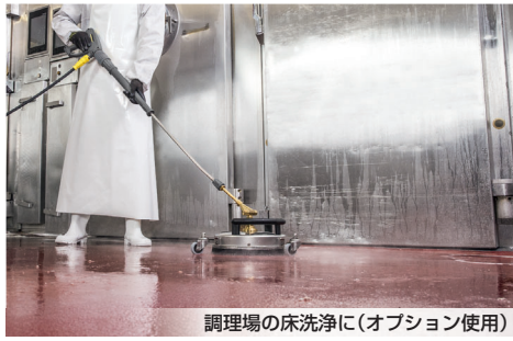
調理場の床洗浄に(オプション使用)