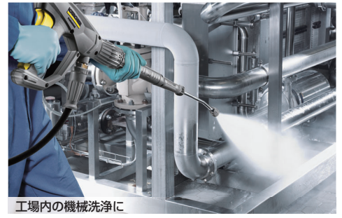
工場内の機械洗浄に