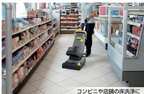
コンビニや店舗の床洗浄に