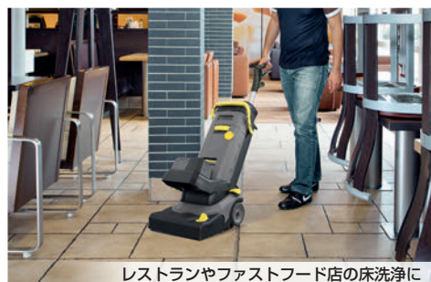
レストランやファストフード店の床洗浄に