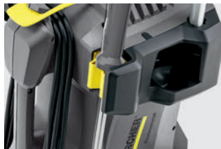
ランス固定ホルダー