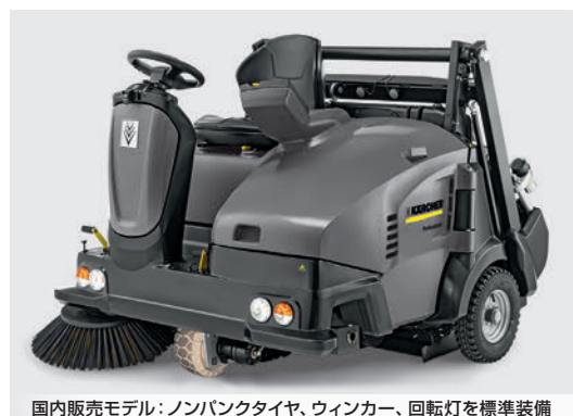
国内販売モデル：ノンパンクタイヤ、ウィンカー、回転灯を標準装備