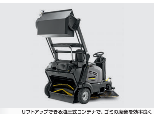
リフトアップできる油圧式コンテナで、ゴミの廃棄を効率良く