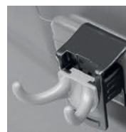
アダプター + ダブルフック