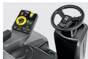
シートに着座しないと電源が入らない安全設計