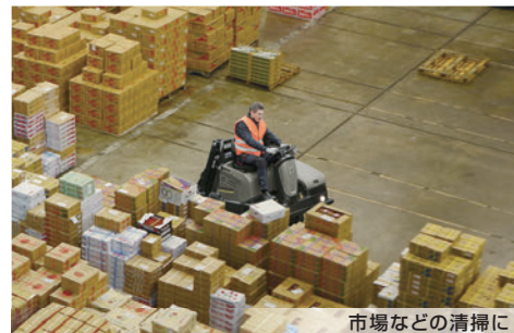
市場などの清掃に