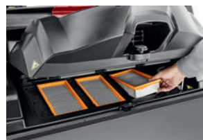
小型化で交換やメンテナンス時間を削減