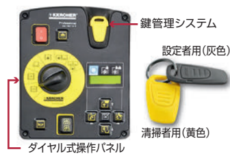
ダイヤル式操作パネル

鍵管理システムにより、清掃者によって生じる過度な設定からの事故を防ぎ、どなたが清掃しても均一な仕上がりが得られます。また、操作パネルはイラストにダイヤルを合わせるだけの簡単操作です。