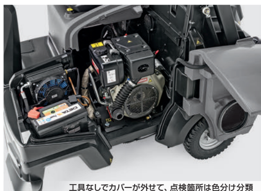
工具なしでカバーが外せて、点検箇所は色分け分類