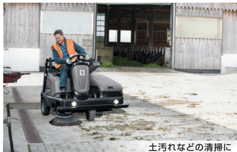
土汚れなどの清掃に