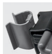
アダプター + モップホルダー