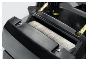
従来機種の筒型フィルター

フィルターは「自動チリ落とし機能」を採用。メンテナンス時間を短縮し、バキューム力を落としません。また、フィルターの小型化により、省スペース化とフィルターコストを抑えられます。