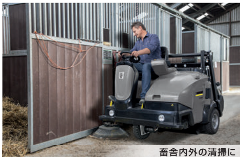
畜舎内外の清掃に