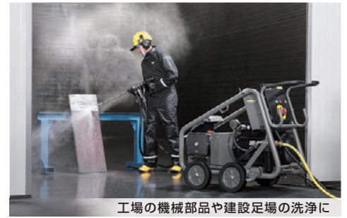
工場の機械部品や建設足場の洗浄に