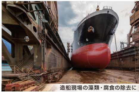
造船現場の藻類・腐食の除去に