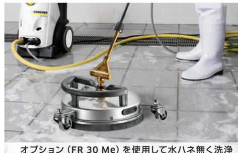
オプション (FR 30 Me) を使用して水ハネ無く洗浄