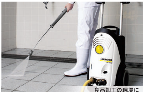
食品加工の現場に