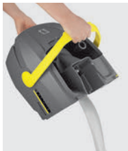
手を汚さず汚水を廃棄