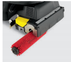
ブラシやスクイジーは工具無しで着脱可能