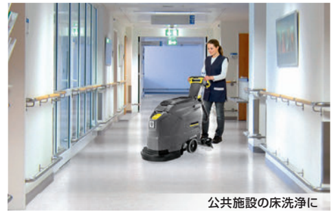
公共施設の床洗浄に