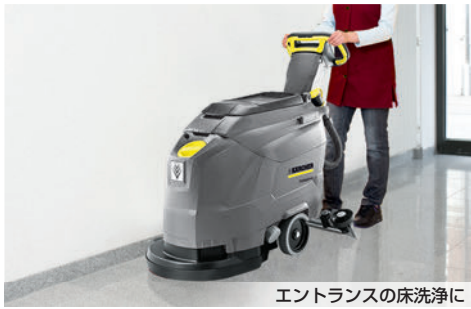
エントランスの床洗浄に