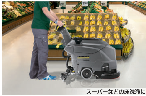
スーパーなどの床洗浄に