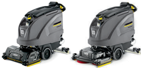
BR 55/60 W Bp DOSE BR 65/60 W Bp DOSE