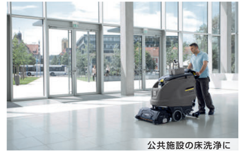
公共施設の床洗浄に