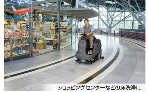
ショッピングセンターなどの床洗浄に