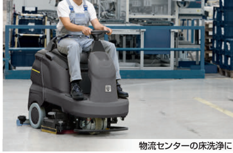
物流センターの床洗浄に