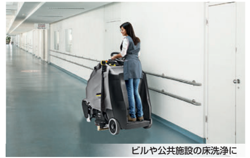
ビルや公共施設の床洗浄に