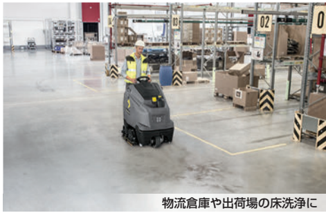
物流倉庫や出荷場の床洗浄に