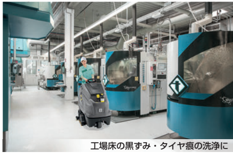
工場床の黒ずみ・タイヤ痕の洗浄に