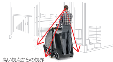
高い視点からの視界

立ち乗り式は視点が高く、人や物への衝突などによる事故を回避しやすく、安全に作業できます。また、小回りが利くため、狭い場所の清掃も容易に行えます。