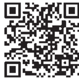
衝撃耐久テスト動画