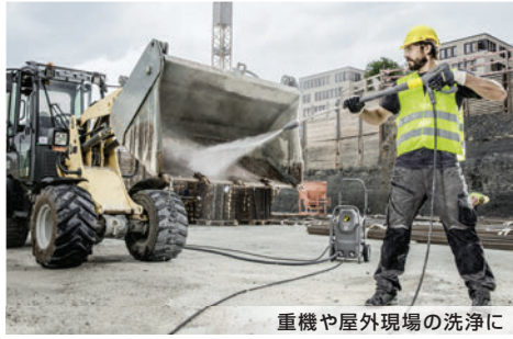
重機や屋外現場の洗浄に