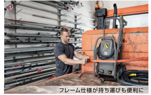
フレーム仕様が持ち運びも便利に