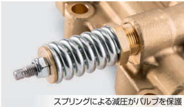
スプリングによる減圧カリバルブを保護

ポンプへの負荷を軽減するオーバーフローバルブ（自動圧力開放バルブ）と、工業用水にも対応する大型フィルターで耐久性が50%アップ*。フレーム仕様が耐衝撃性もアップし、メンテナンスと修理コストを軽減します。