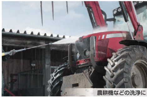
農耕機などの洗浄に