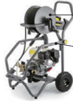
ホースリール マウントキット 注文番号:2.110-004.0

オプションのホースリールを使用することで、長い高圧ホースも簡単に収納できます。フレームはエンジンを保護し破損を防ぎます。