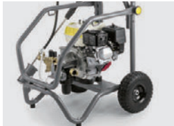
上部フレームはオプション装備

フレームは耐腐食性、ポンプは真ちゅう製シリンダーヘッド、ピストンはステンレス製を採用し、厳しい使用環境でも信頼に応えます。