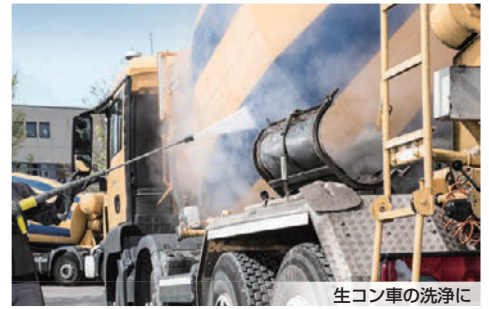
生コン車の洗浄に