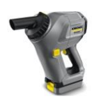
T 9/1 バッテリー HV 1/1 Bp

※ニュースリリースに記載された内容は発表時の情報です。 予告なく変更する場合がありますので、ご了承ください。