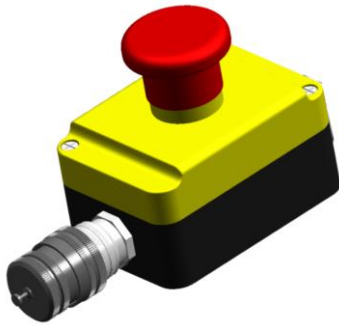
Штекер / Plug