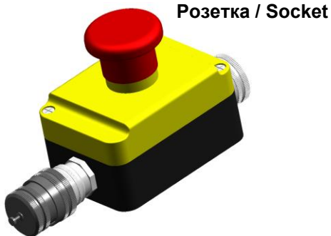
Розетка / Socket