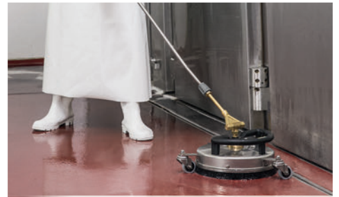
オプション FR 30 Me で食品工場の床洗浄に