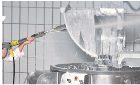
オプション INNO ツインフォームランスで機械を泡洗浄