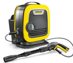
家庭用高圧洗浄機 K MINI

2017年、「日本人の生活環境に合致する製品」の開発を目指すJAPANプロジェクトが発足し、その第一弾となる製品がK MINIです。プロジェクトを通して、「持ち運びやすいサイズと重量」、「収納場所に困らないコンパクトさ」を備えた高圧洗浄機が求められていることが明確になり、2年の歳月を経て日本のお客様に最適な高圧洗浄機が誕生しました。