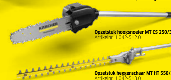
Opzetstuk hoogsnoeier MT CS 250/36 Artikelnr. 1.042-512.0