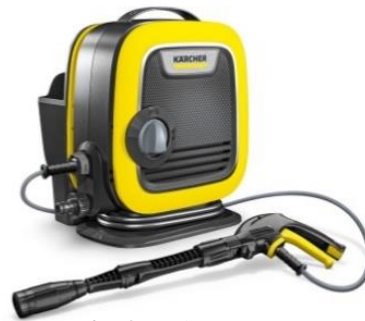
家庭用高圧洗浄機 K MINI

2017年、ケルヒヤーで「日本人の生活環境に合致する製品」の開発を目指すJAPANプロジェクトが発足しました。K MINIはその第一弾となる製品です。プロジェクトを通して、「持ち運びやすいサイズと重量」、「収納場所に困らないコンパクトさ」を備えた高圧洗浄機が求められていることが明確になり、2年の歳月を経て日本のお客様に最適な高圧洗浄機が誕生しました。日本の住環境やライフスタイルに合うデザイン性、スリムで扱いやすく丈夫な高圧ホース、そして本体と付属品がコンパクトに収納できるスマート設計が「K MINI」の特徴です。