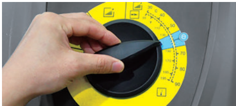
低燃費で環境にもやさしいエコモード搭載

エコモード機能により、一定の温度を保つことで燃料を節約し、清掃コストを抑えることができます。