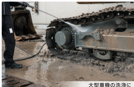
大型重機の洗浄に