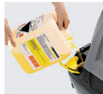
ガイド付の大型補給口