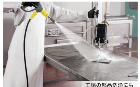
工場の部品洗浄にも