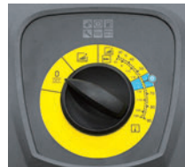
シンプル操作の大型ダイヤル

作業内容が一目で分かるイラスト入りダイヤルで、どなたでも操作できます。また、洗浄剤と燃料の補給口が大きく、液ダレを防ぎ床を汚しません。