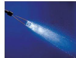
強力な水圧で清掃効率が向上 (ヒートコイル: 3年保証)

パワーノズルは、ムラのない強力な水圧で作業効率を高めます。ボイラーはステンレス製のヒートコイルを採用。安定した温水を供給します。