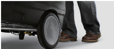
スムーズに移動できる大型タイヤ

大型タイヤで広い清掃範囲をカバーします。持ちやすいハンドルにより取り回しも容易です。また、コンパクトなため省スペースで設置できます。