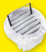
Taschenfilter «M» 1,4 m 2

Die Sonderausführung IVR 35/20-2 Sc Me für brennbare Stäube ist mit einem Taschenfilter der Staubklasse «M» und einer Filter-Patrone der Staubklasse «H» als Zusatzfilter ausgestattet.**