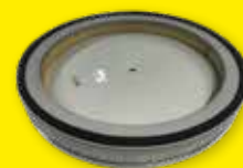
Filter «H» 0,37 m 2