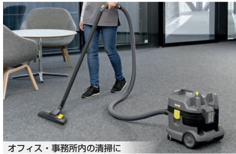
オフィス・事務所内の清掃に