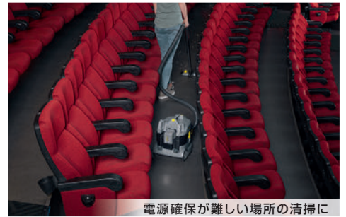
電源確保が難しい場所の清掃に