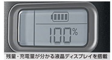
残量・充電量が分かる液晶ディスプレイを搭載