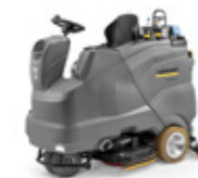
床洗浄機 B 150 R BP Dose