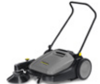
スィーパー KM 70/20 C