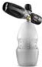
Schuimlans met tank

zonder Servo-Control sproeiergrootte 42 - Bestelnr. 9.994-477.0