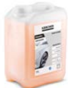
RM 838 3 L