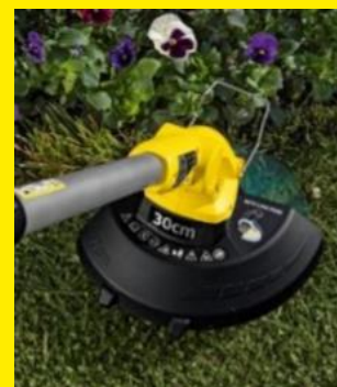
花や植木周りの雑草