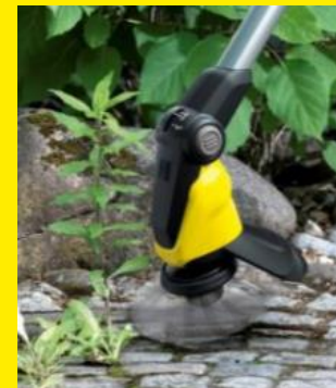
隙間に生えた雑草