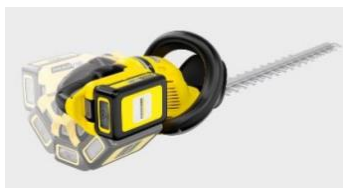
ロング仕様刈刃と 回転ハンドル