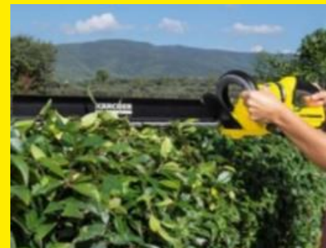
刈った枝葉は落とさず集める