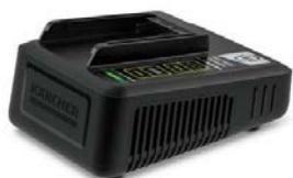
バッテリーパワー専用 急速充電器 BC 18V