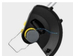
新開発の刈刃： ナイロンストリップ