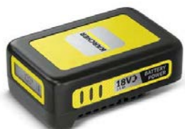
バッテリーパワー 18V2.5AH