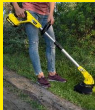
芝生や雑草の除去