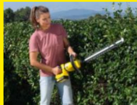
縦も横も自由自在