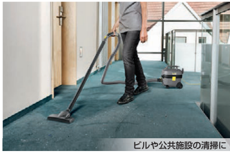
ビルや公共施設の清掃に