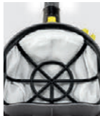
合成繊維 フィルターバスケット