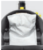
合成繊維 フィルターバック

高品質な3層構造のフィルターでモーターを保護し、吸引力を保ちます。合成繊維素材のフィルターは耐久性が高く、メンテナンスコストを削減します。