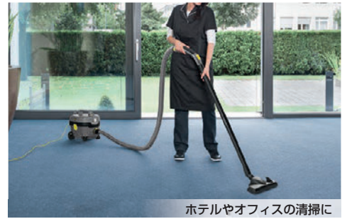
ホテルやオフィスの清掃に