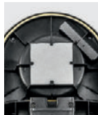
モーター保護 フィルター