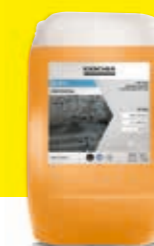
Agente protector superior CP 950