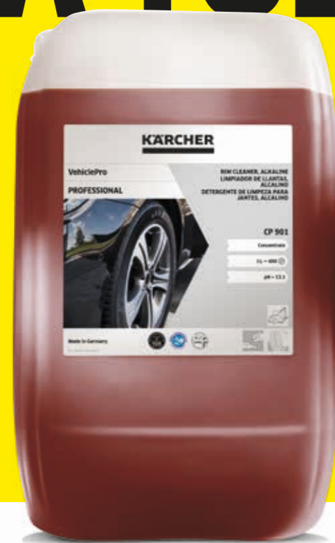
Limpiador de llantas, alcalino CP 901