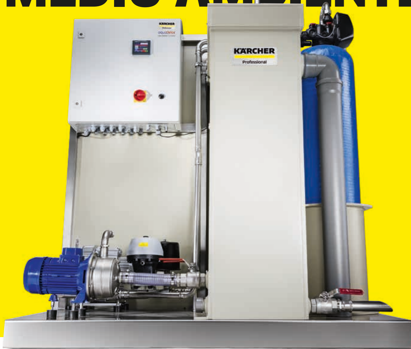
Instalación de reciclaje de agua WRB Bio

No solo palabras, sino hechos. La protección medio-ambiental y la sostenibilidad están en boca de todos. Esta es nuestra y su contribución al tema.