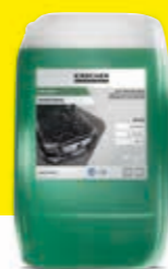
Lavado a alta presión CP 935