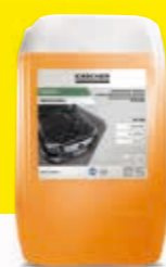
Disolvente de suciedad intenso CP 930