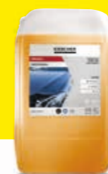
Cera caliente CP 945