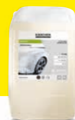
Espuma activa CP 940