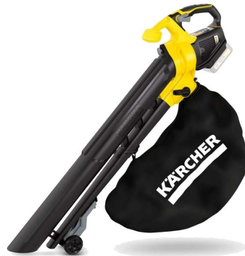
ブロー&バキューム BLV 18-200