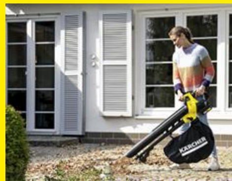
落ち葉の吹き飛ばし