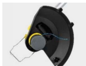
新開発の刈刃： ナイロンストリップ