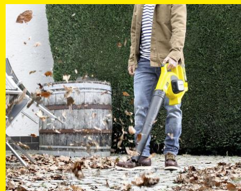
落ち葉の吹き飛ばし