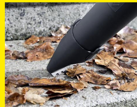
フラットノズルで風向きも調整