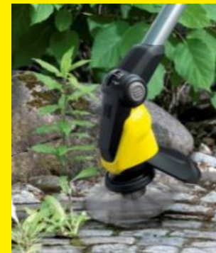
隙間に生えた雑草