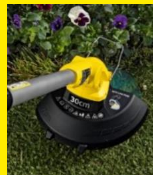
花や植木周りの雑草