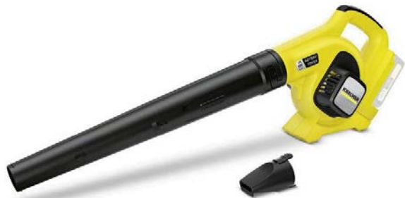
ブロー LBL 2