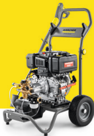
Hochdruckreiniger mit Verbrennungsmotor