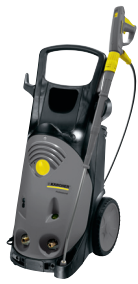
HD 10/22 S