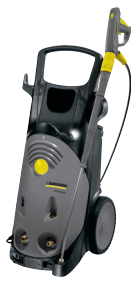
HD 13/15 S