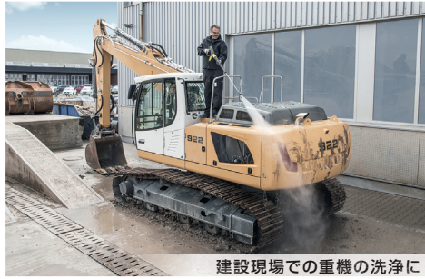
建設現場での重機の洗浄に