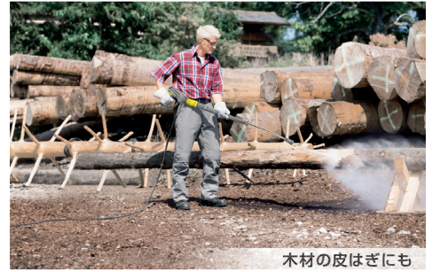
木材の皮はぎにも