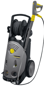
HD 10/22 SX