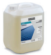
カーペット Pro ディープクリーナー RM 764(10L)