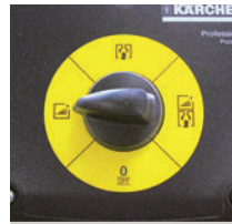
シンプルな操作ダイヤル

操作は作業イラストに合わせてダイヤルを回すだけ。マシンは工具を使わずにパーツの着脱やメンテナンスが可能です。大型タイヤで移動しやすく、階段も引き上げて移動できます。