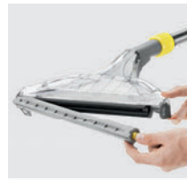
パーツの着脱に工具不要