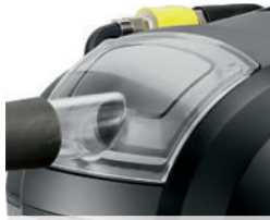
汚水タンク入り口でも確認可能