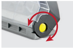
吸引口は床に平行のままヘッドが回転