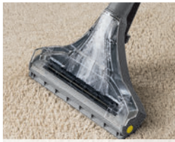
吸引する汚れを目視確認

透明カバーで吸引する洗浄水の透明度を確認でき、洗い残しを防げます。ノズルが見えない設置物の下を洗浄中でも、汚水タンク入り口で確認が可能です。