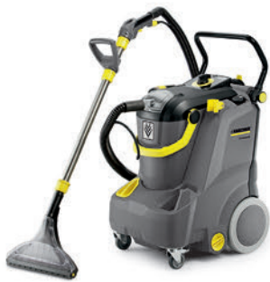
大広間のような広範囲のカーペット洗浄に