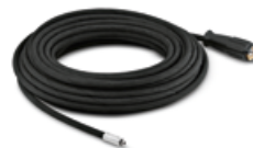
Furtun iSolar HP, 10 m Cod comandă: 6.392-977.0