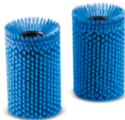
Perie rolă moale Cod comandă: 4.762-623.0