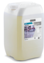
Soluție pentru îndepărtarea urmelor de roți și de cauciuc RM 776, 20 litri Cod comandă: 6.295-546.0