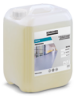
Soluție pentru îndepărtarea petelor cerate și polimeri FloorPro RM 754, 10 litri Cod comandă: 6.295-811.0