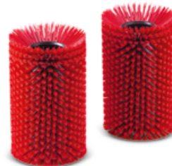
Perie rolă medie Cod comandă: 4.762-624.0