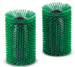
Perie rolă tare Cod comandă: 4.762-625.0