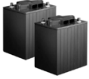
Set baterii gel 76 Ah pentru BD 50/50, B 40 Cod comandă: 2.815-099.0