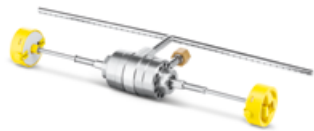
Transmisie completă pentru perile rolă Cod comandă: 4.762-584.0