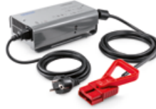
Încărcător 12A IEB pentru BD 50/50, B 40 Cod comandă: 6.654-329.0