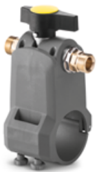
Adaptor de joasă presiune TL Cod comandă: 4.580-097.0