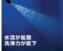
水流が拡散 洗浄力が低下