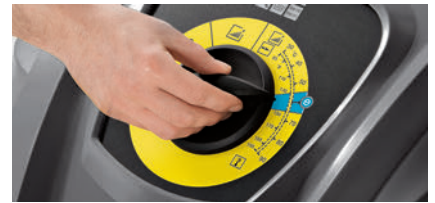
低燃費で環境にもやさしいエコモード搭載

エコモード機能で一定の温度を保ち、燃料と洗浄剤を節約。清掃コストを抑えることができます。