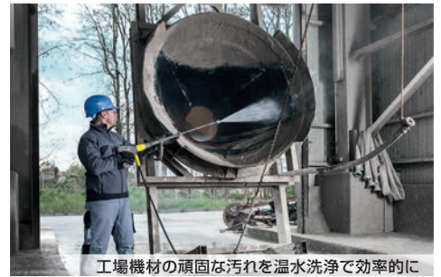
工場機材の頑固な汚れを温水洗浄で効率的に