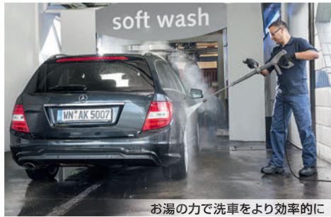
お湯の力で洗車をより効率的に