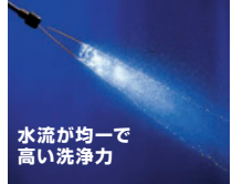
水流が均一で 高い洗浄力