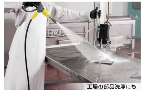
工場の部品洗浄にも