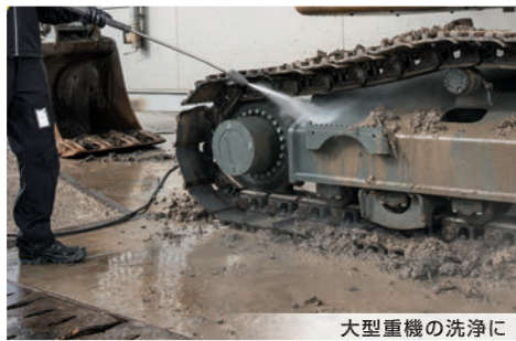
大型重機の洗浄に