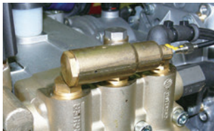
エンジン速度調整機能(エンジン式)