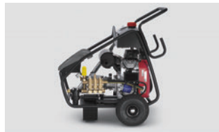
本体ユニットを守る頑丈なフレーム