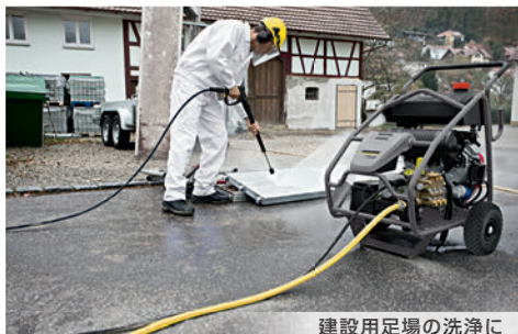
建設用足場の洗浄に