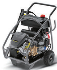
HD 13/35 Ge HD 9/50 Ge