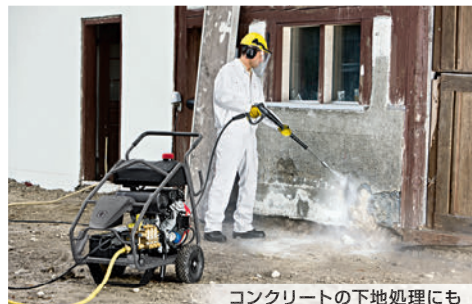
コンクリートの下地処理にも