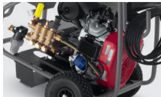
信頼のホンダ製エンジン(エンジン式)

※1) エンジン式モデルに搭載。作業をしていない時にエンジンの回転を抑え、エンジンへの負荷を軽減することでトラブルを防ぎます。