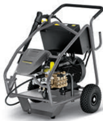
HD 13/35-4 Cage HD 9/50-4 Cage