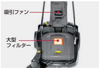
吸引ファン 大型 フィルター

コンテナに掃き込まれた細かなチリやホコリは、吸引ファンによって大型フィルターに取り込まれます。飛散を防ぎ、周りの空気を汚しません。