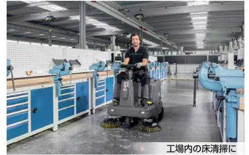
工場内の床清掃に