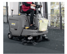
カーベットキット装着イメージ