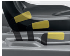
フィルターちり落としレバー

フィルターちり落とし機能で、吸引力を落とさず高い清掃能力を維持出来るとともに、定期メンテナンスの時間を削減します。