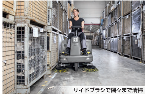
サイドブラシで隅々まで清掃