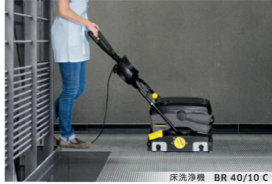
床洗浄機 BR 40/10 C