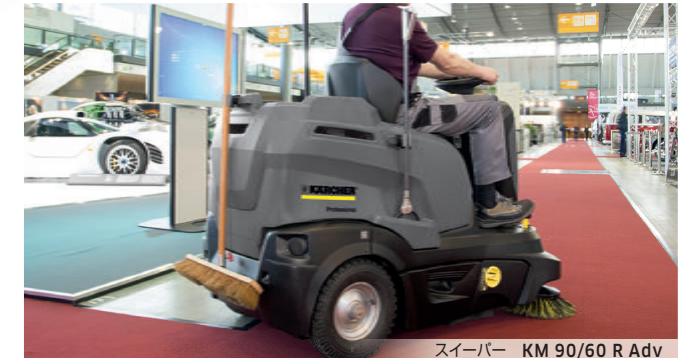
スーパースーパー KM 90/60 R Adv