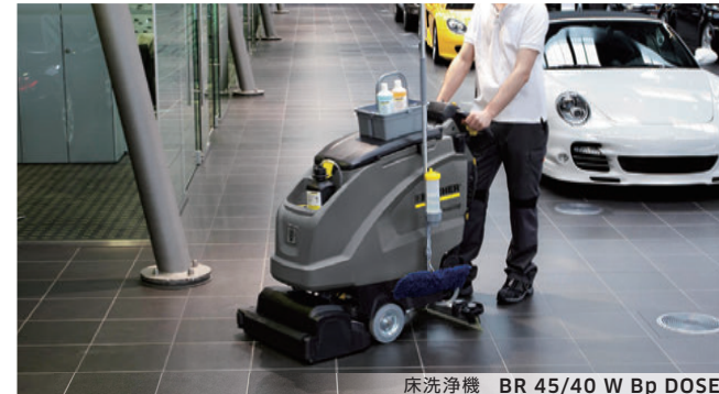
床洗浄機 BR 45/40 W Bp DOSE