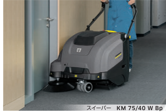
スーパースーパー KM 75/40 W Bp