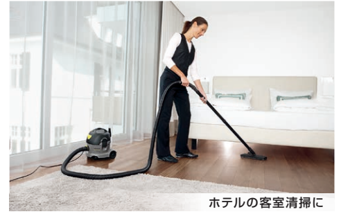
ホテルの客室清掃に