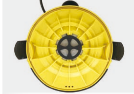
モーター保護フィルター