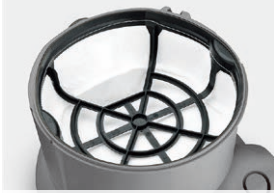
合成繊維フィルターバスケット

コンパクトな本体に1,200Wの強力モーターを搭載。パワフルな吸引力で作業時間を削減します。また、2層構造のフィルターでモーターを保護し、吸引力を落とさせません。作業時間を短縮し、清掃の負担を削減します。