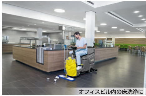
オフィスビル内の床洗浄に