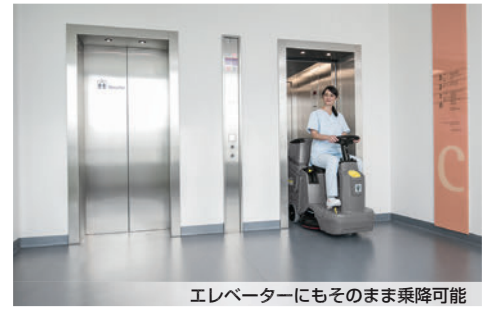
エレベーターにもそのまま乗降可能