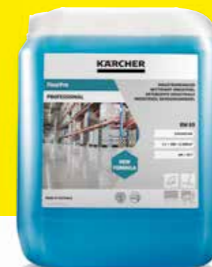
FloorPro Industriereiniger RM 69

In Abhängigkeit vom Verschmutzungsgrad, dem Einsatzort und dem jeweiligen Bodenbelag empfiehlt Kärcher unterschiedliche Reinigungsmittel zum Einsatz mit dem Reinigungsroboter KIRA B 50 – jeweils natürlich perfekt auf das Gerät abgestimmt, sicher in der Anwendung und umweltfreundlich im Einsatz.