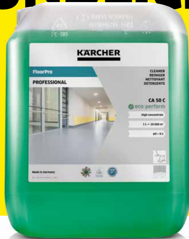
FloorPro Reiniger CA 50 C eco!perform