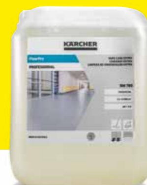
FloorPro Wischpflege Extra RM 780