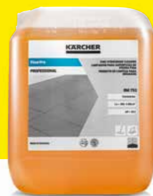
FloorPro Feinsteinzeugreiniger RM 753