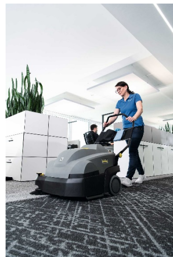
営業時間中も気にならない静音性でオフィス内の清掃も可能