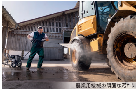
農業用機械の頑固な汚れに