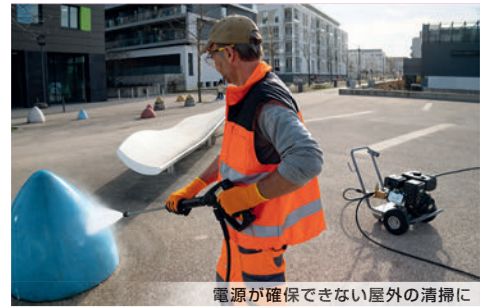
電源が確保できない屋外の清掃に