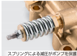
スプリングによる減圧がポンプを保護