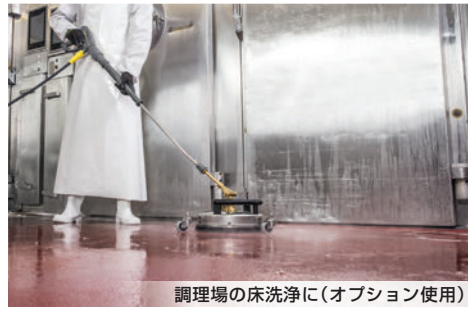
調理場の床洗浄に(オプション使用)