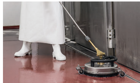
オプション FR 30 Me で食品工場の床洗浄に