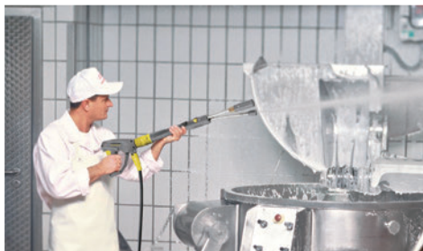
オプション INNO ツインフォームランスで機械を泡洗浄