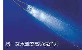
均一な水流で高い洗浄力